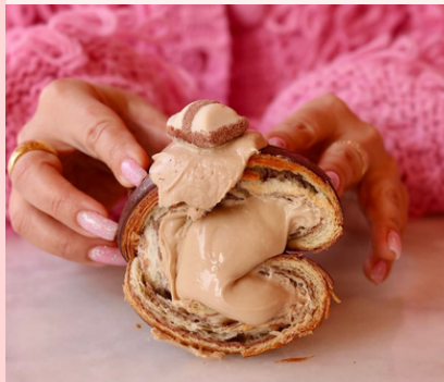
Kinder Bueno 4.00